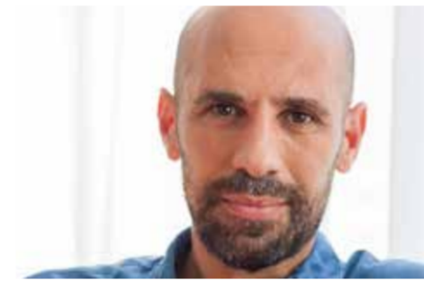
Abdelkader Benali Kracht van verhalen

‘Door elkaar verhalen te vertellen, vertellen we wie we zijn voor elkaar. Het is de basis van onze menselijke verstandhouding.’ Abdelkader Benali is schrijver en programmamaker. Benali werd geboren in Marokko, maar kwam op vierjarige leeftijd naar Rotterdam. Later verhuisde hij naar Amsterdam. Benali schrijft behalve romans en toneel ook artikelen en recensies voor onder meer Algemeen Dagblad, de Groene Amsterdammer, Esquire, de Volkskrant en Vrij Nederland. Voor zijn romandebuut ‘Bruiloft aan zee’ werd hij in 1997 genomineerd voor de Libris Literatuur Prijs, die hij in 2003 kreeg voor zijn tweede roman, ‘De langverwachte’. Hij woont afwisselend in Amsterdam en Tanger. Momenteel loopt in het wereldmuseum in Rotterdam zijn tentoonstelling, ‘ik kijk, dus ik ben’.